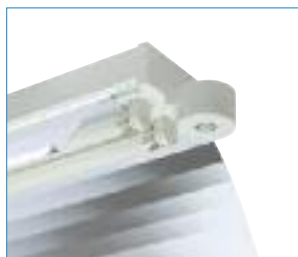
Réflecteur miroir avec capteur SMART